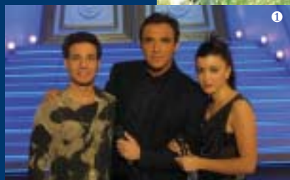
1 Star Academy 2 Astérix et Obélix 3 Coupe du Monde 2002